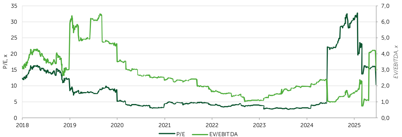
Иллюстрация 4. KASE индексінің акциялары бойынша Freedom Broker-ден ағымдағы бағалаулардың пайыздық арақатынасы