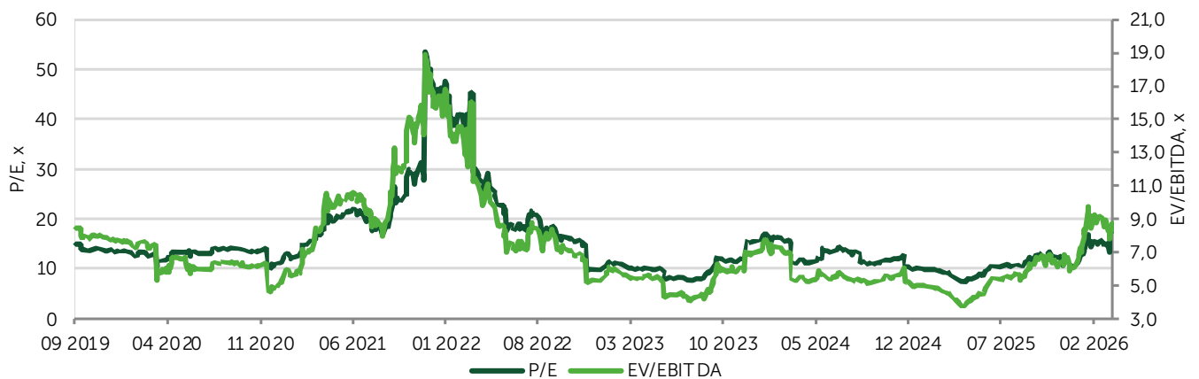
Иллюстрация 4. Иллюстрация 4. Процентное соотношение текущих оценок от Freedom Broker по акциям индекса KASE