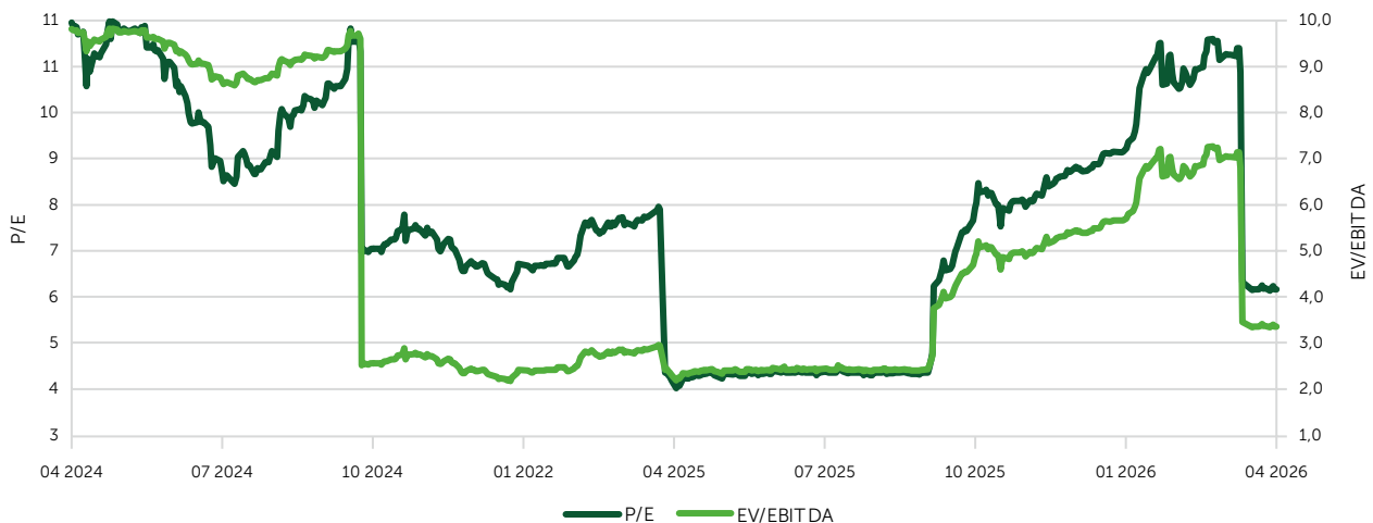
Иллюстрация 4. Процентное соотношение текущих оценок от Freedom Broker по акциям индекса KASE